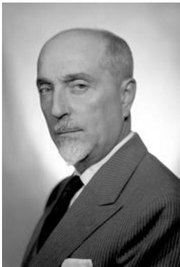
Prof. Giuseppe Medici